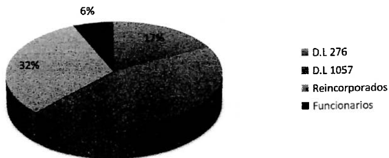
Gobierno regional Junín por régimen laboral