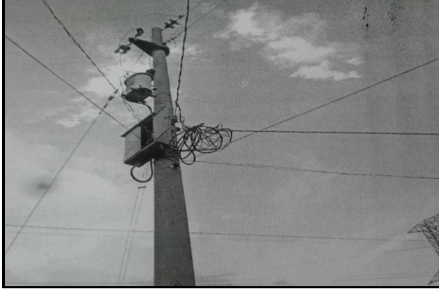
DESCRIPCION: OBRA CULMINADA Y EN FUNCIONAMIENTO