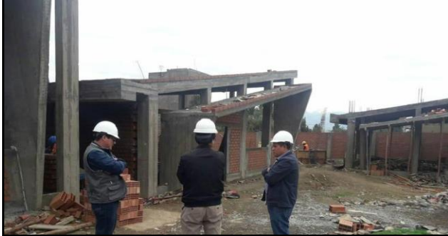
DESCRIPCION: EN EJECUCION CON UN AVANCE ACUMULADO AL 41.08%, EN PROCESO DE INTERVENCION ECONOMICA, POR RETRASO EN OBRA