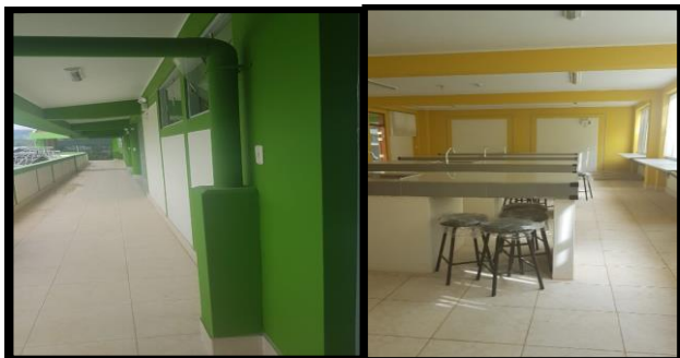
DESCRIPCION: VISTAS DE LA OBRA