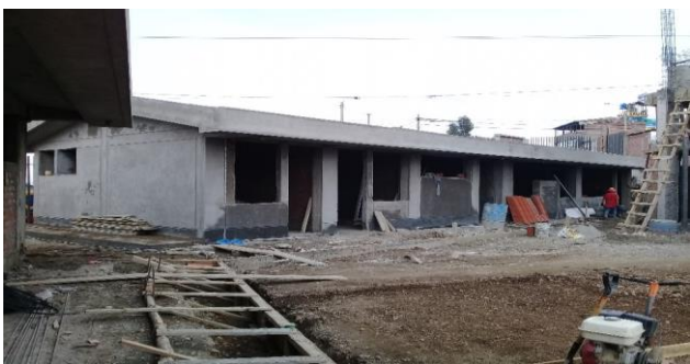
FOTOGRAFIA DE OBRA

DESCRIPCION: VISTA DEL AREA ADMINISTRATIVA