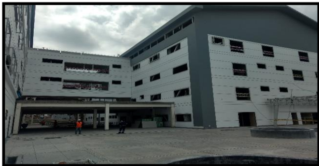
DESCRIPCION: VISTA DE LA FACHADA DEL HOSPITAL EL CARMEN