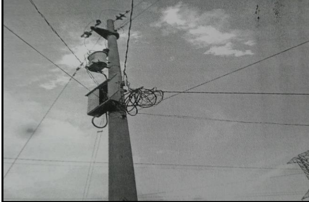
DESCRIPCION: OBRA CULMINADA Y EN FUNCIONAMIENTO