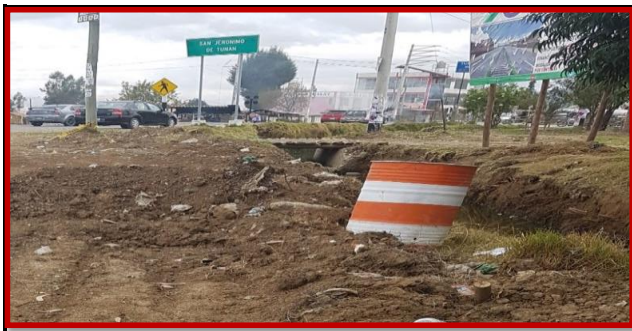
DESCRIPCION: Excavacion de Alcantarilla N° 01 - 0 + 020 progresiva