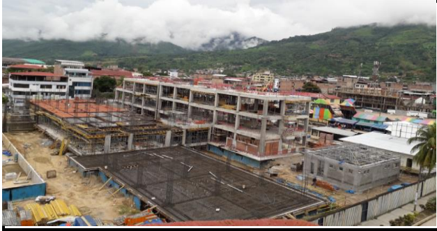
DESCRIPCION: VISTA AEREA DEL PABELLON CENTRAL