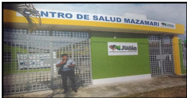
DESCRIPCION: VISTA FRONTAL DE LA EJECUCION DE OBRA