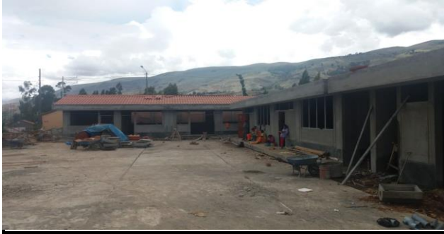
DESCRIPCION: VISTA DEL INTERIOR DE LA ESCUELA