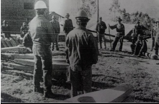
DESCRIPCION: SE APRECIA LA VISTA EN EL MOMENTO DE CULMINACIÓN DE OBRA