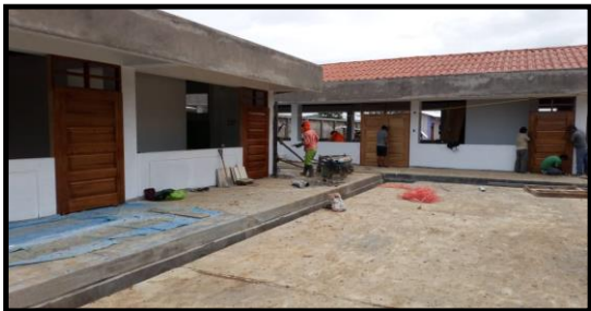
DESCRIPCION: VISTA FRONTAL DE LA EJECUCION DE OBRA