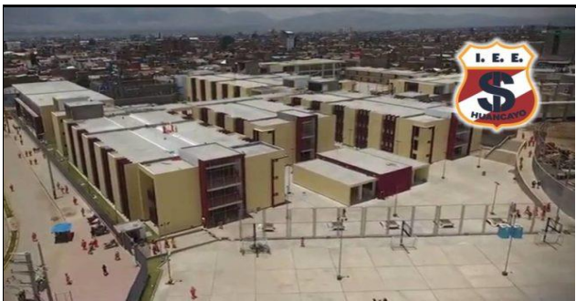
DESCRIPCION: VISTA AEREA DEL PABELLON DE SECUNDARIA