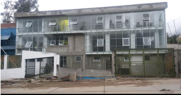
DESCRIPCION: VISTA FRONTAL DEL PUESTO DE SALUD