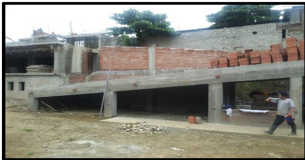
DESCRIPCION: VISTA FRONTAL DE LA EJECUCION DE OBRA