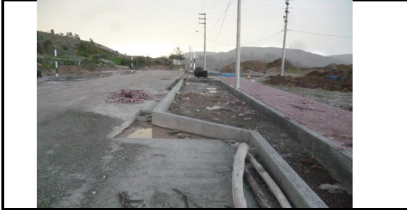
DESCRIPCION: FOTO 007: CUNETA DE DRENAJE AJUN POR TERMINAR EN MUCHOS TRAMOS DE LA OBRA.