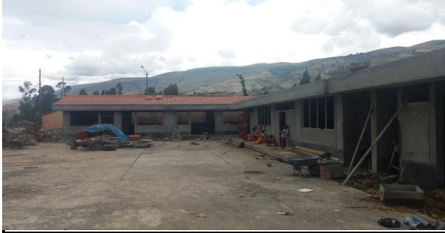
DESCRIPCION: VISTA DEL INTERIOR DE LA ESCUELA