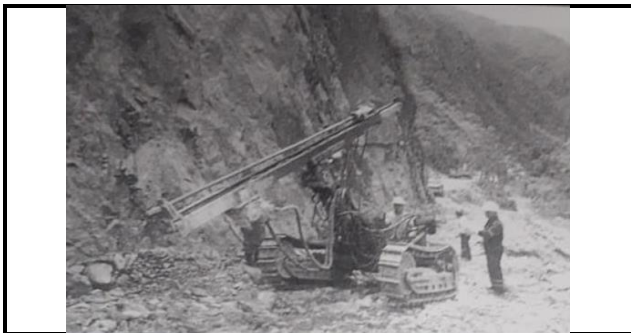
DESCRIPCION:FOTO 001: TRABAJOS DE PERFORACION EN ROCA FIJA, CON EQUIPO TRACKDRILL