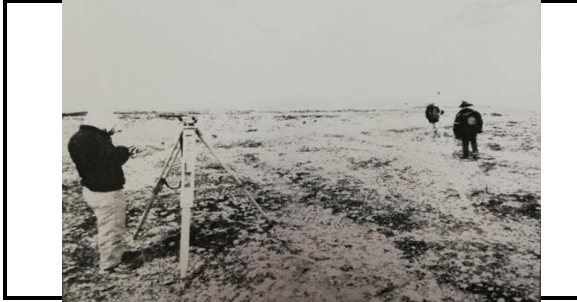
DESCRIPCION:FOTO 001: INICIO DE PROYECTO KM 0+000