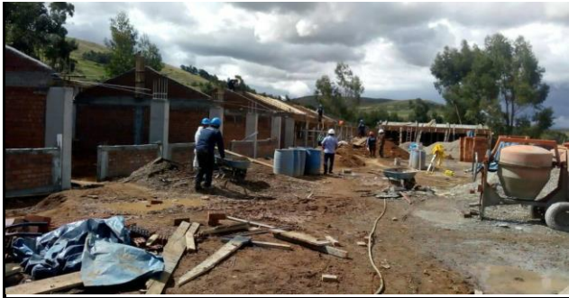
DESCRIPCION: EN EJECUCION CON AVANCE ACUMULADO AL 29.14%